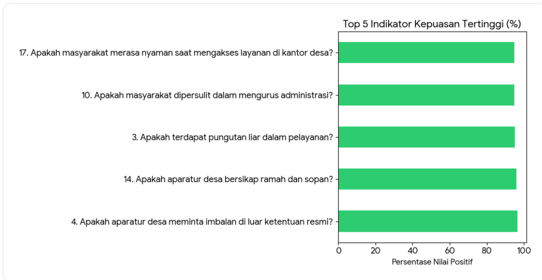
Grafik 2: 5 Indikator dengan Skor Tertinggi

Berdasarkan data survey, indikator dengan nilai tertinggi menunjukkan bahwa masyarakat merasa sangat nyaman dan menganggap aparatur desa bersikap jujur serta profesional dalam menjalankan tugasnya.